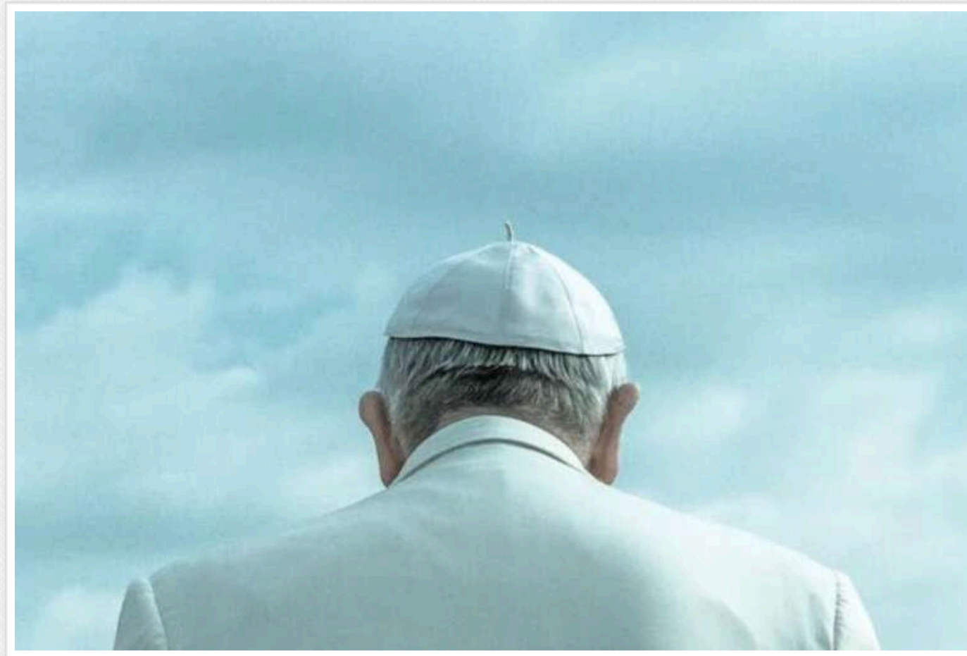
Бюджетний дефіцит Ватикану зріс втричі за час понтифікату Франциска через фінансову непрозорість

Бюджетний дефіцит Ватикану потроївся під час понтифікату Папи Франциска, попри численні спроби реформувати фінансову систему, повідомляє The Wall Street Journal.