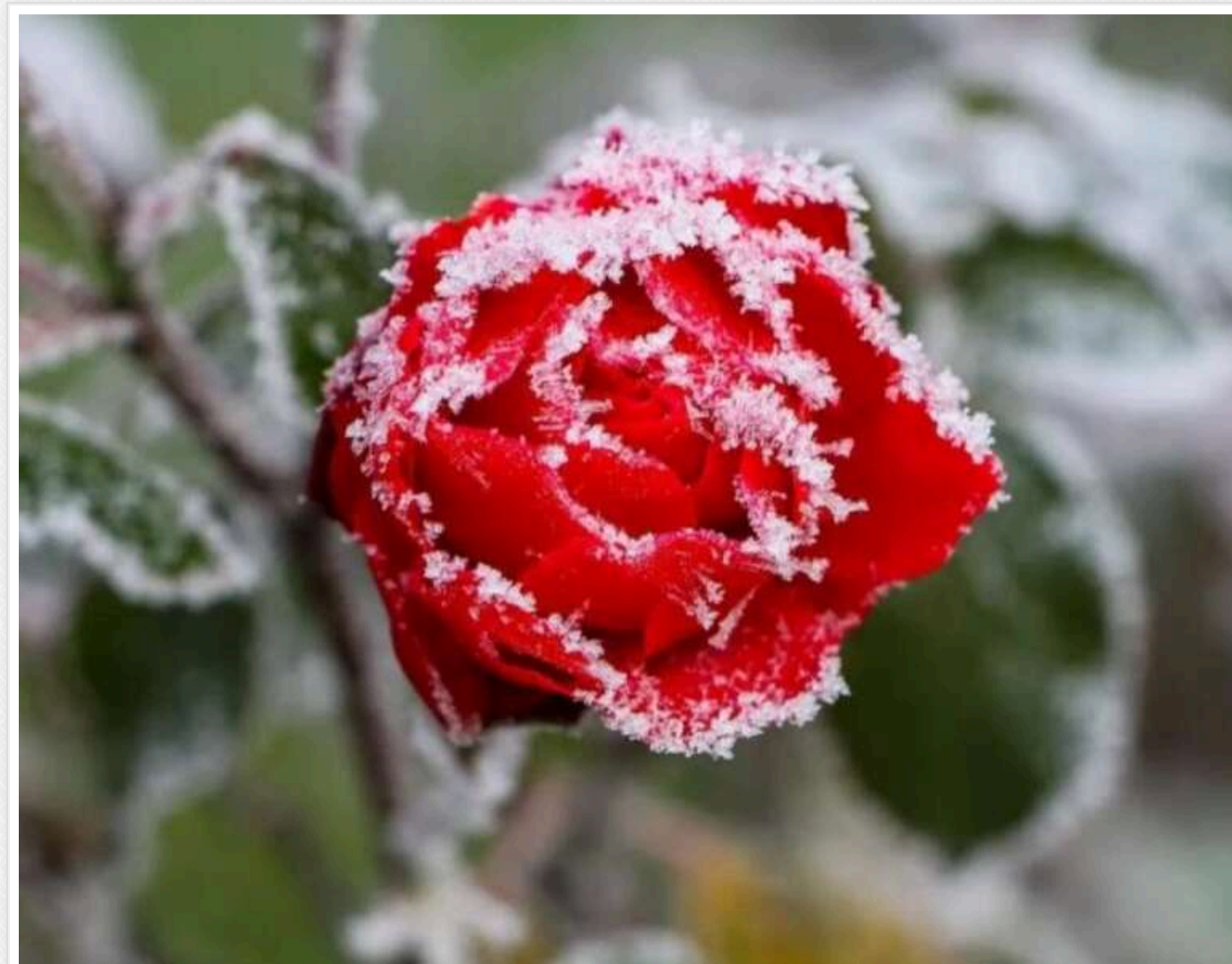
В Україні завтра очікуються заморозки та дощі, - Укргідрометцентр

У ніч поти 9 та 10 травня у північно-західних областях України прогноуються заморозки на поверхні ґрунту до -5°C, попереджає Укргідрометцентр.