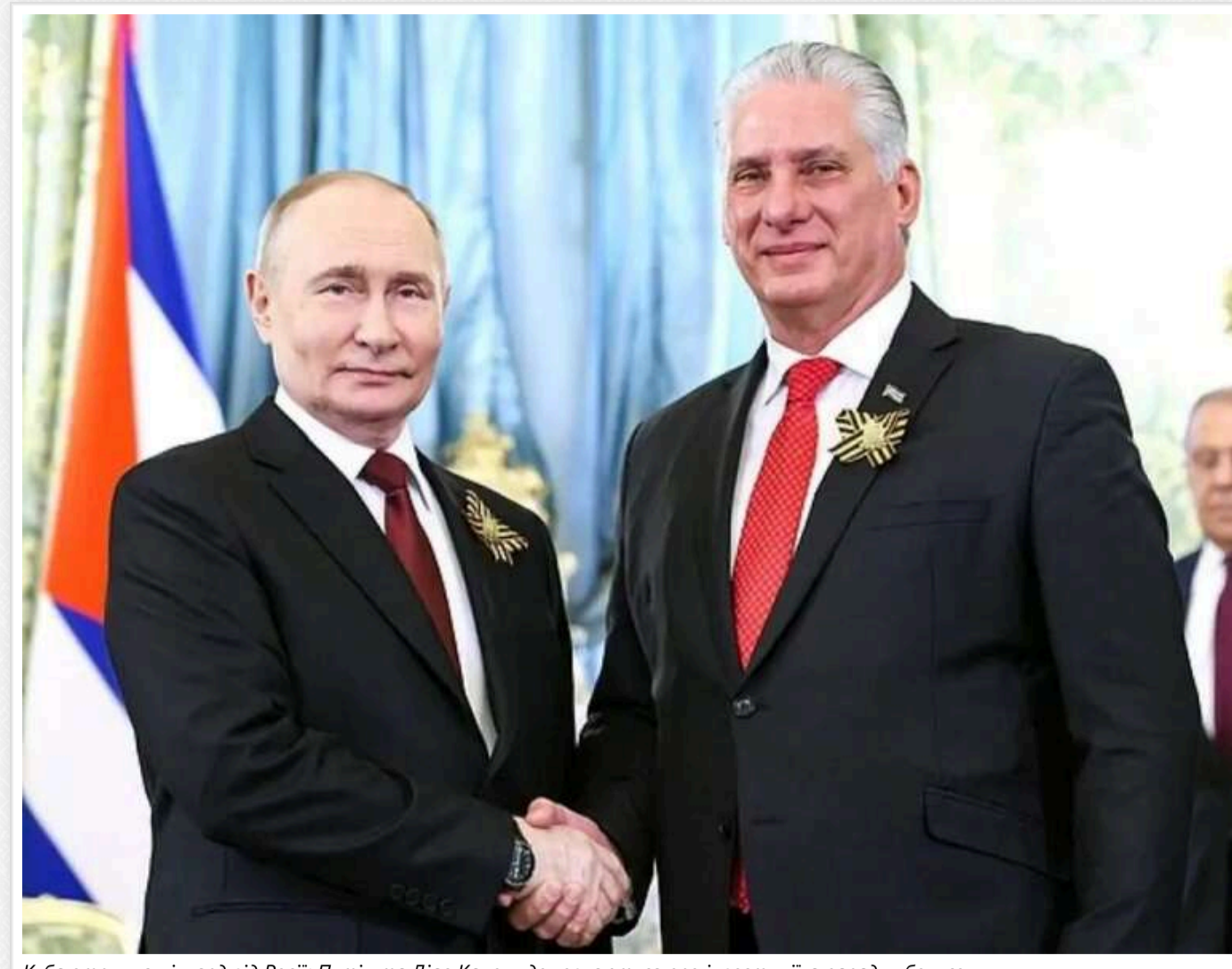
Куба отримує мільярд від Росії: Путін та Діас-Канель домовляються про інвестиції, а парад – бонусом

Президент Куби Мігель Діас-Канель Бермудес прибув до Москви 9 травня і візьме участь у параді. За це він отримає значну винагороду.