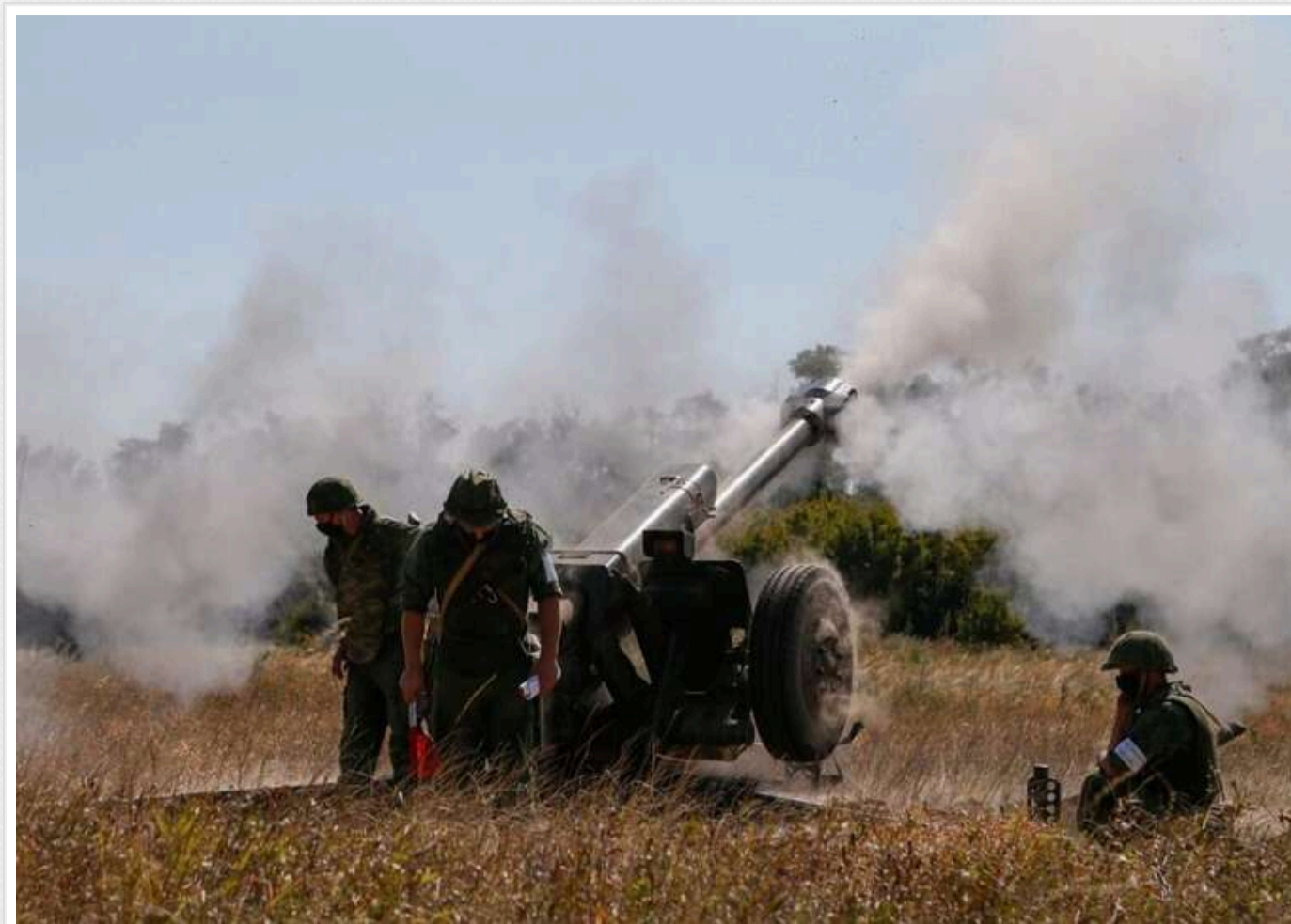
Ситуація на фронті: попри "перемир'я" на фронті сталося 154 бої, окупанти здійснили 2685 обстрілів

Хоч Росія нібито заявила про "перемир'я" з 8 по 10 травня, на фронті сьогодні відбулося 154 бойові зіткнення. Третина боїв - на Покровському напрямку.