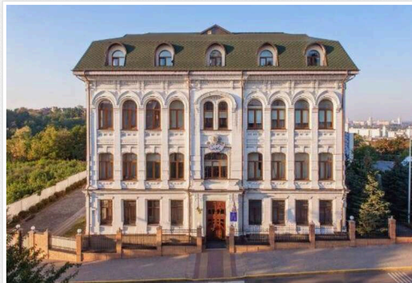
Новий керівник Головного сервісного центру МВС придбав чилер для будівлі за 2,7 мільйона гривень

Читати на руском Read in English Додати як бажане джерело в Google