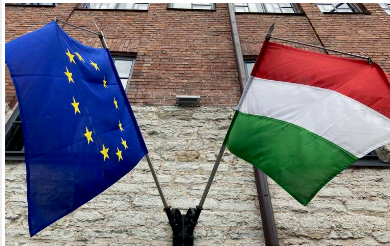
Угорщина не перешкоджає схваленню 17-го пакету санкцій проти Росії, його затвердять у травні

Угорщина не заперечує проти ухвалення нового, 17-го пакету санкцій Європейського Союзу проти Росії, який може бути офіційно затверджений вже у травні 2025 року.