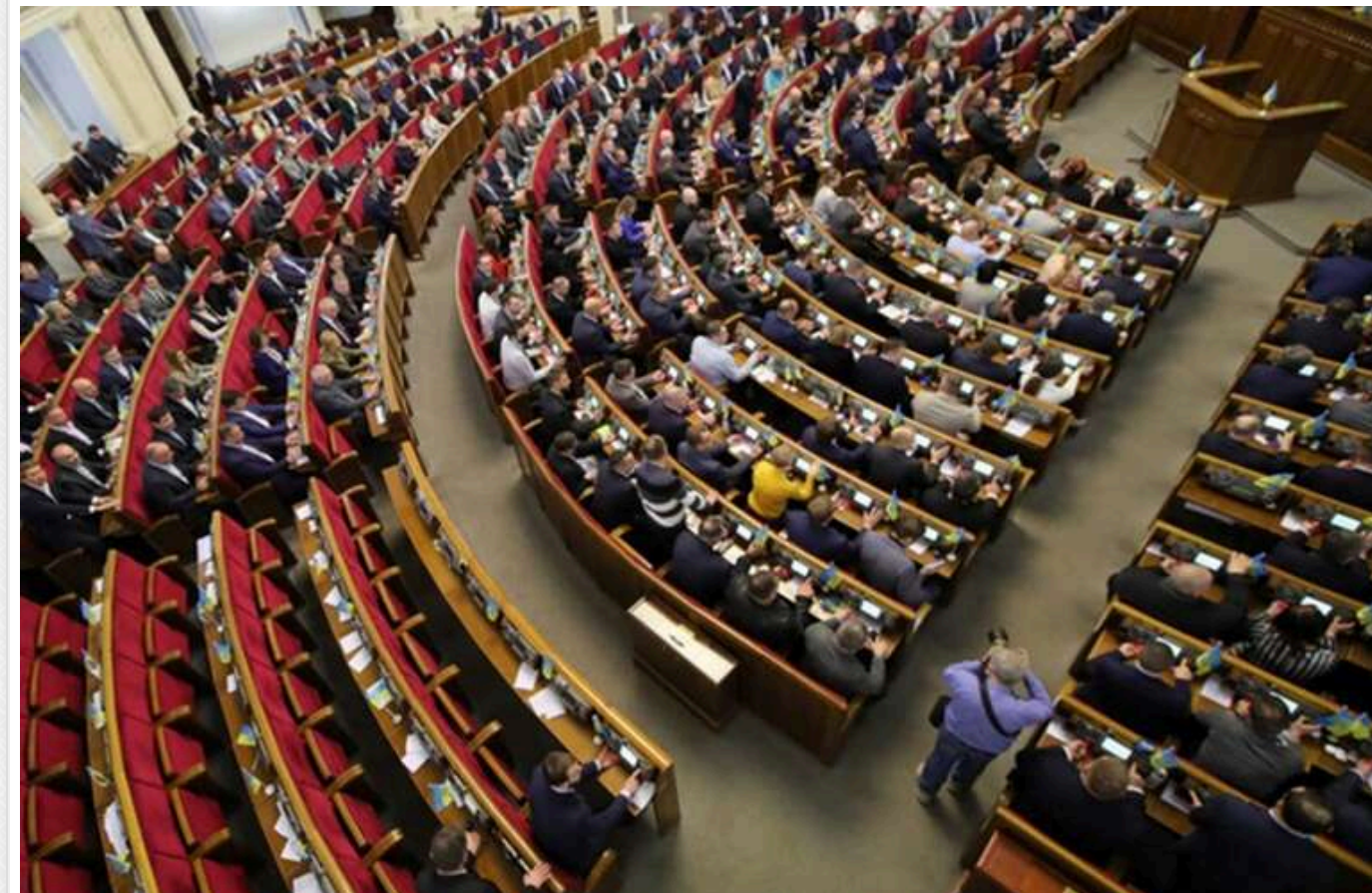
За 2024 рік нардепи отримали 7,1 мільярда гривень доходу: детальний розбір декларацій

Читати на руском Додати як бажане джерело в Google