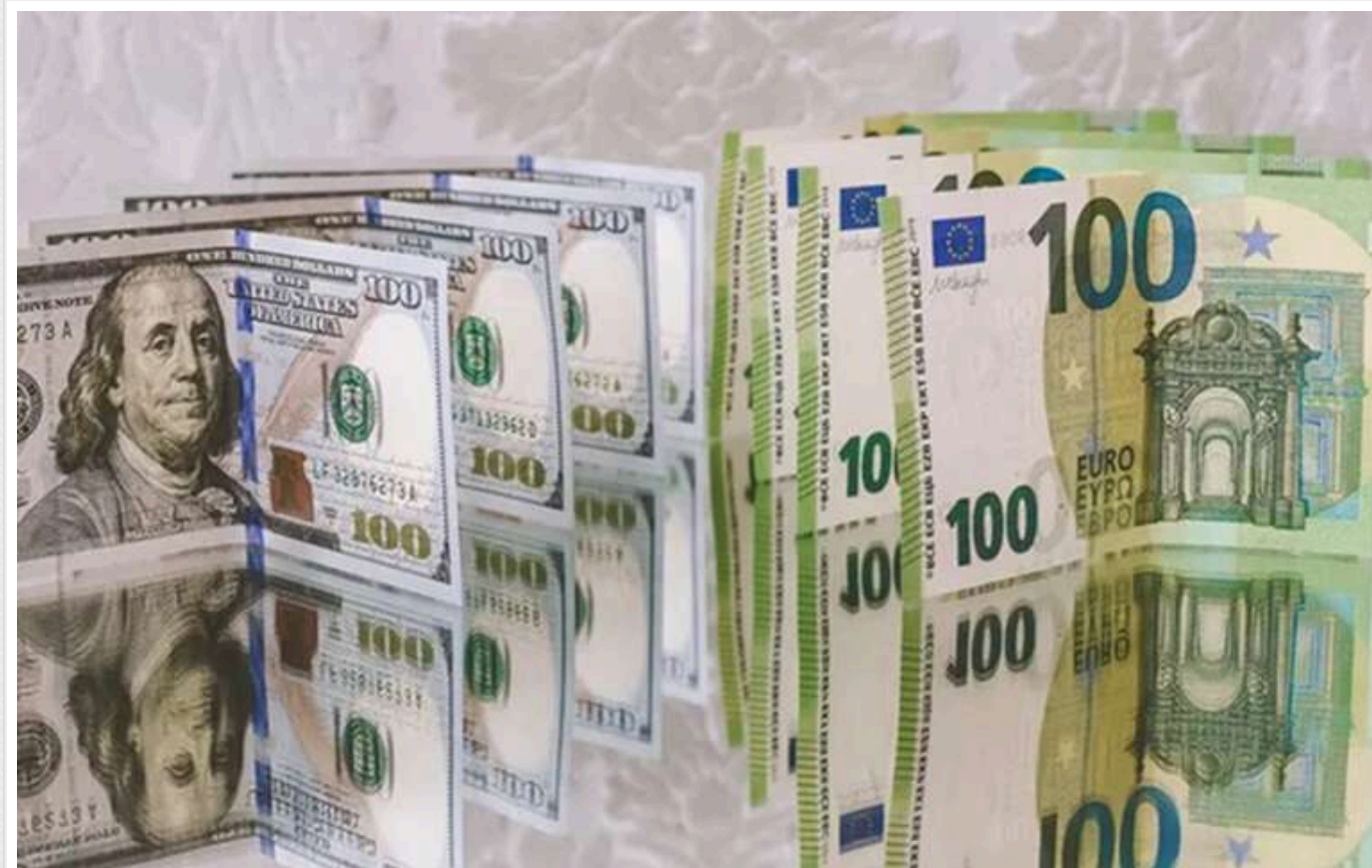
Україна розглядає можливість переходу від долара до євро як базової валюти

Україна розглядає можливість відмови від використання долара США й більш тісного прив'язування своєї валюти до євро.