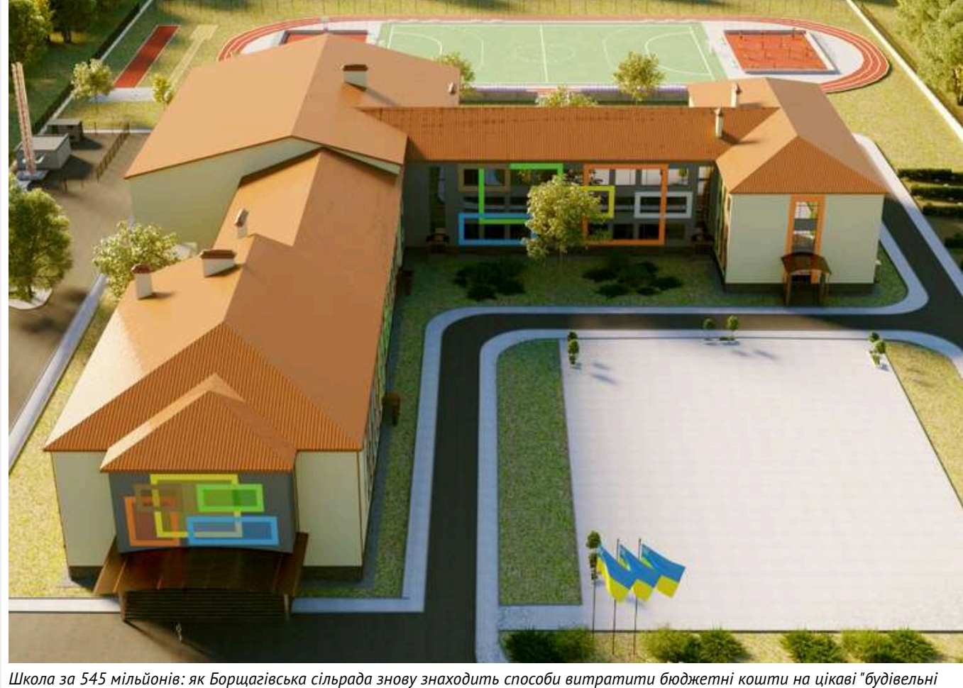
Школа за 545 мільйонів: як Борщагівська сільрада знову знаходить способи витратити бюджетні кошти на цікаві "будівельні рішення"

Читати на руському Додати як бажане джерело в Google