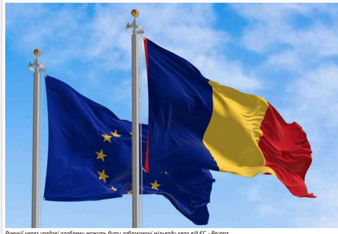
Румунії через урядові проблеми можуть бути заблоковані мільярди євро від ЄС, - Reuters

В рамках майбутнього 17-го пакету санкцій проти Росії, Європейський Союз розглядає можливість введення обмежень проти осіб, яких підозрюють у використанні хімічної зброї в Україні.