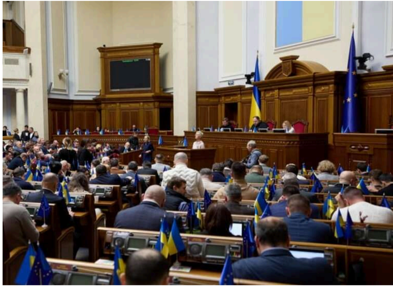
Завтра ВР розгляне ратифікацію договору з США стосовно надр, - нардеп

Читати на русском Додати як бажане джерело в Google