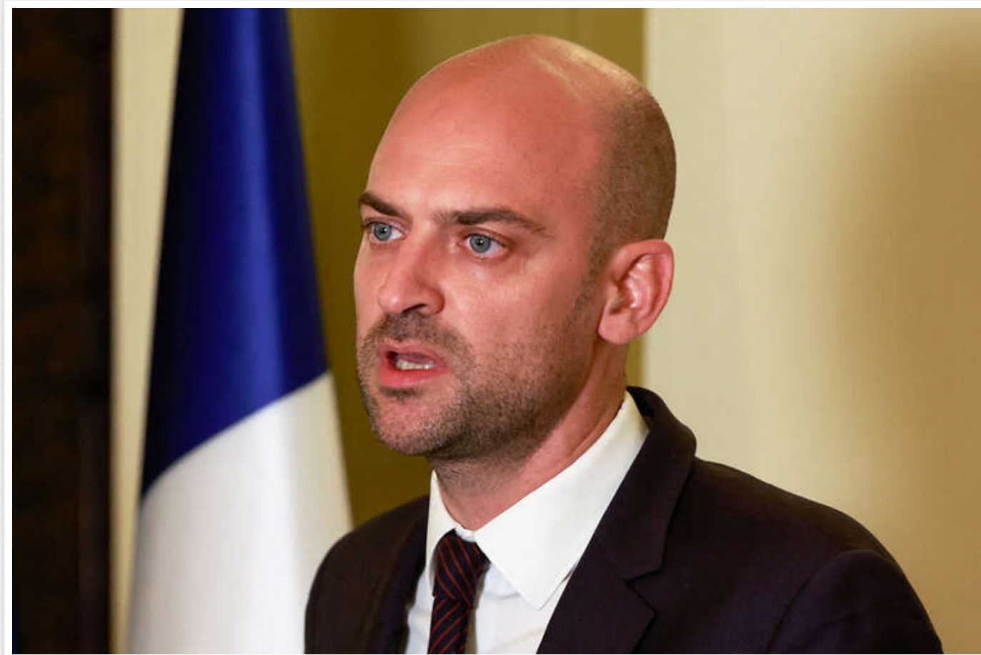
У Франції упевнені, що російські активи залишаться замороженими

У ЄС існує «міцна єдність» щодо продовження санкцій, які дозволять залишити замороженими російські активи.