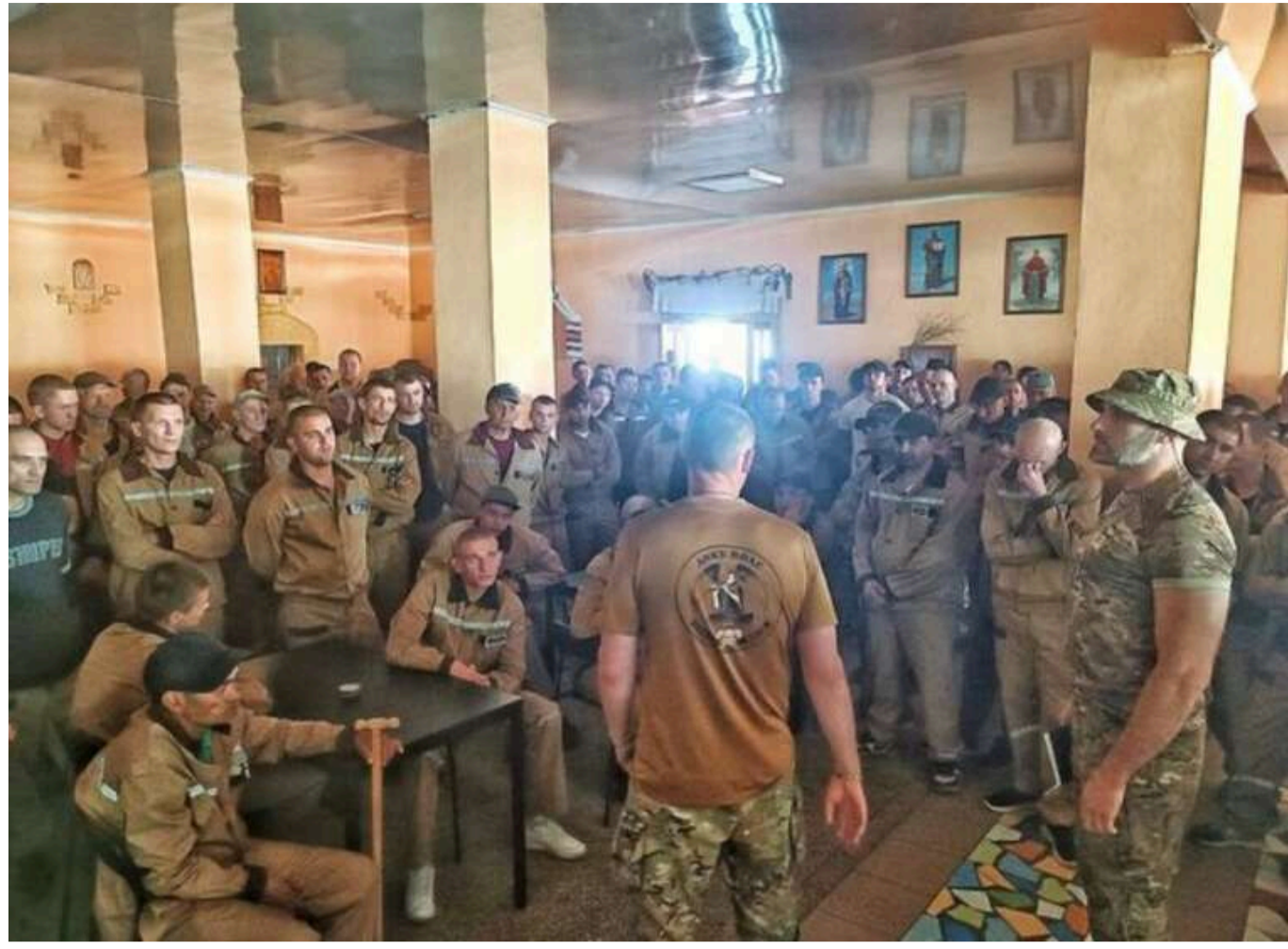
До складу ЗСУ можуть приєднатися до 30% засуджених, - Мін'юст

Читати на русском Read in English Додати як бажане джерело в Google