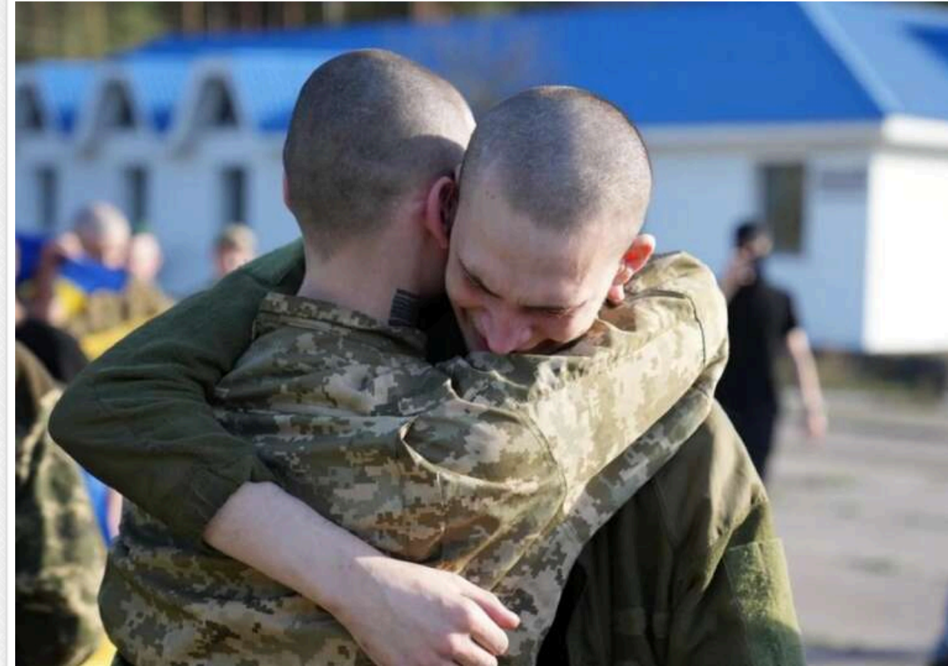
У ДПСУ показали зворушливе відео з обміну полоненими: "Дякую, що все це витримали. Ви наші герої"

6 травня відбувся черговий обмін полоненими між Україною та Росією. У результаті обміну з російського полону повернулися 205 українських військовослужбовців.