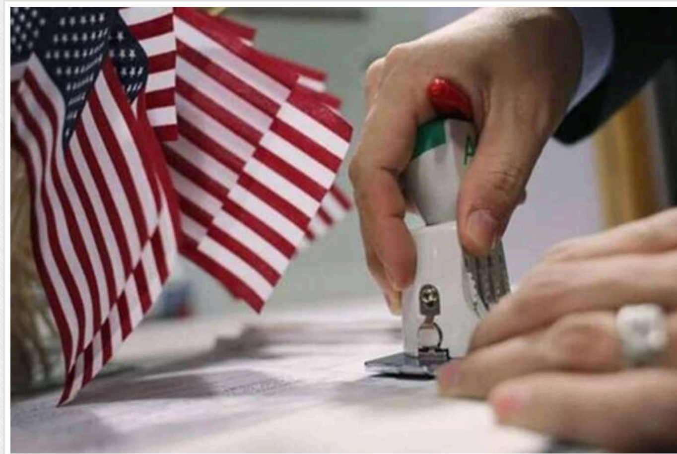
WP: США хочуть висилати депортованих мігрантів в Україну

У розпал війни у Вашингтоні з'явилася пропозиція щодо розміщення в Україні депортованих зі Сполучених Штатів іноземців.