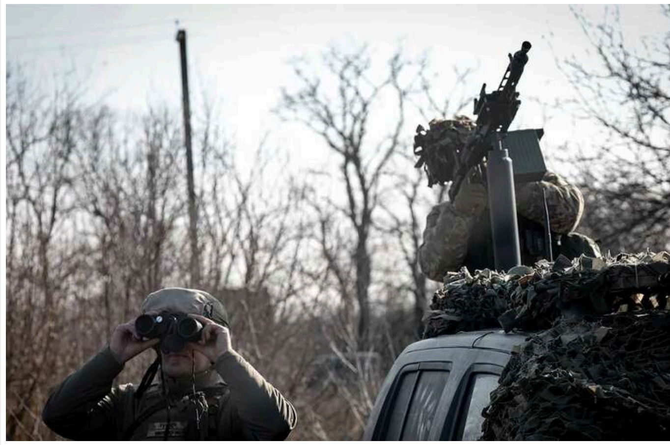
У Києві працює ППО: кількість постраждалих зросла до 8

Читати на руском Read in English Додати як бажане джерело в Google