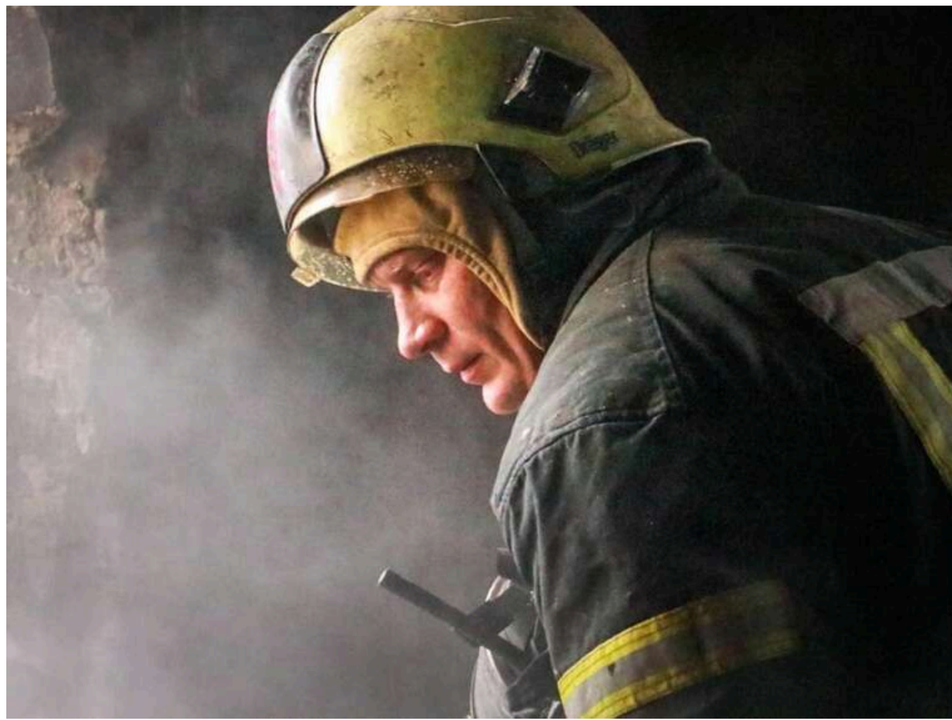
Атака "шахедів" по Запоріжжю: Росіяни нанесли щонайменше 13 ударів, під завалами знаходяться двоє людей

Читати на руськом Read in English Додати як бажане джерело в Google