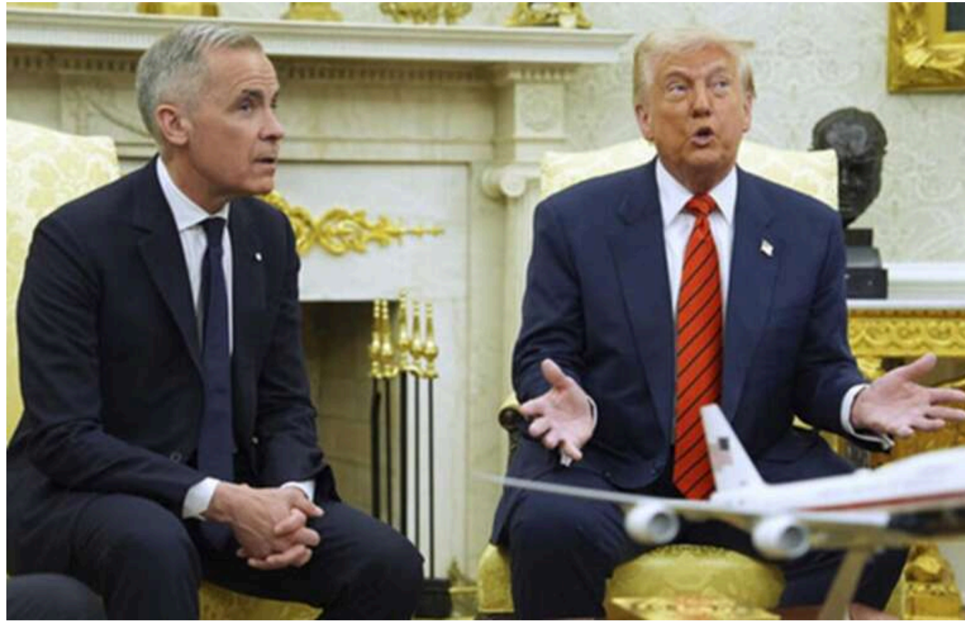
Карні заявив, що "Канада не продається" у відповідь на пропозицію Трампа стати 51-м штатом

Прем'єр Канади Карні в Білому домі заявив, що "Канада не продається" у відповідь на слова Трампа про те, що Канада може стати 51-м штатом США. На це Трамп відповів: "ніколи не кажи ніколи".