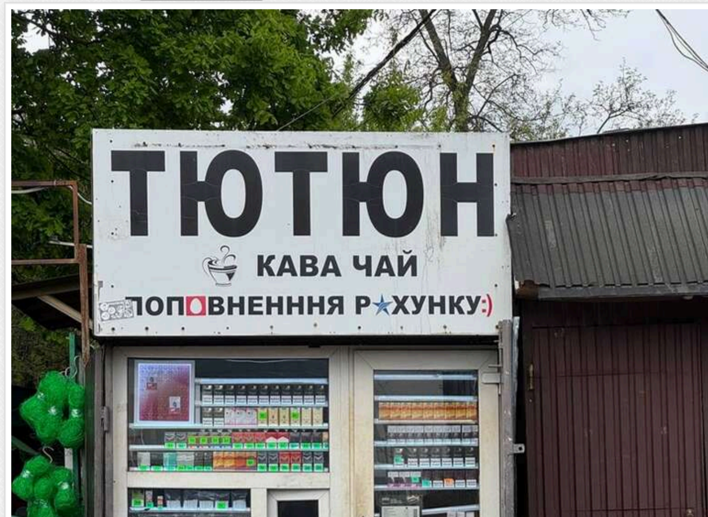
Пакетик "Ротманса" за ціною кави: на Київщині в кіосках торгують контрафактними сигаретами просто з вітрини

Читати на руськом Додати як основне джерело в Google