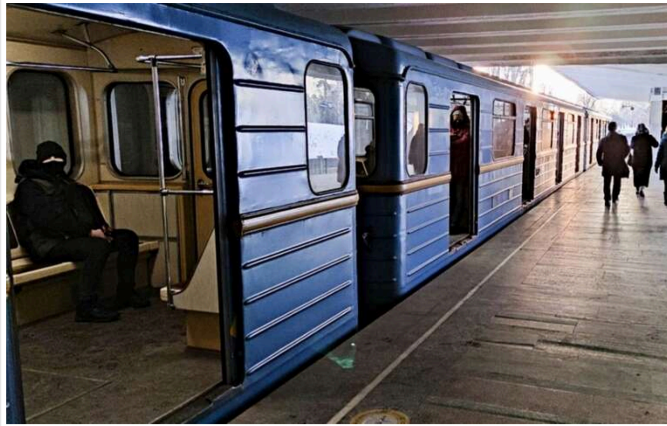
Тендер на 9,6 мільйона євро для київського метро: обмеження конкуренції, ризики РФ і запитання без відповідей

Конкурс на постачання активного мережевого обладнання, яке є "нервовою системою" столичного метро, викликав хвилю скарг та запитань, які залишилися без відповіді.