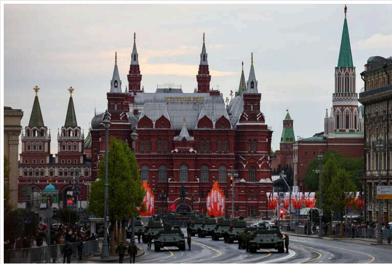
У Кремлі заявили, що на параді будуть присутні 29 зарубіжних лідерів

На параді 9 травня на Червоній площі в Москві очікується присутність 29 іноземних лідерів, зокрема з Китаю, Бразилії, Казахстану, Білорусі, Єгипту та Венесуели.