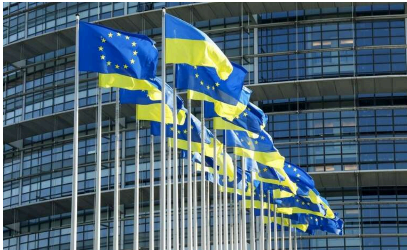
ЄС офіційно звинуватить Росію в бойовому застосуванні хімічної зброї в Україні

Читати на руськом Read in English Додати як бажане джерело в Google