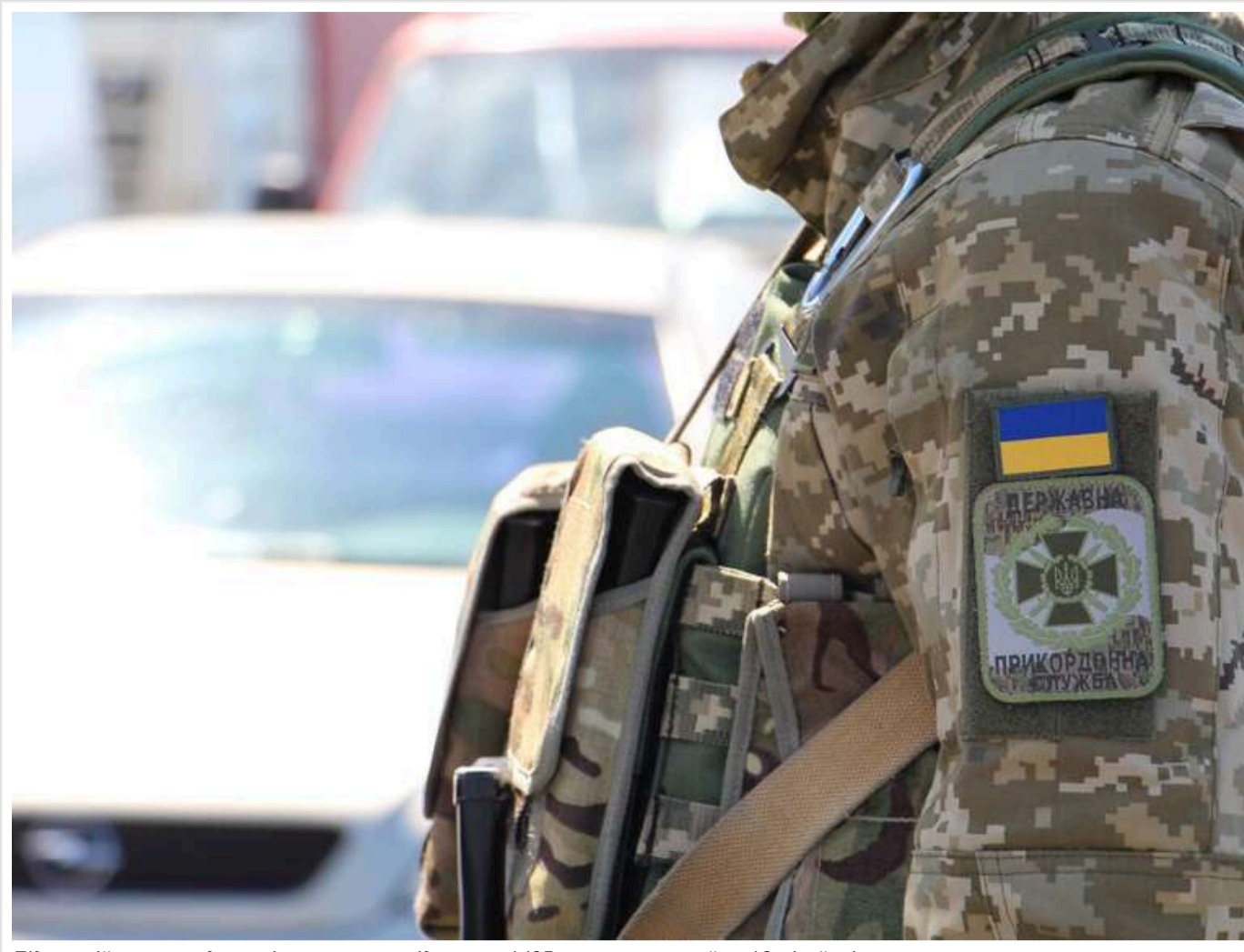
Під час війни прикордонників намагались підкупити 1493 рази на суму майже 18 мільйонів гривень

Читати на руском Read in English Додати як бажане джерело в Google