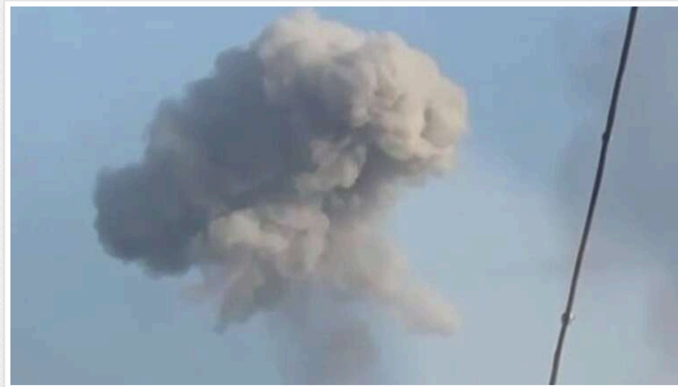
На Дніпропетровщині було чути вибух

Читати на руском Read in English Додати як бажане джерело в Google