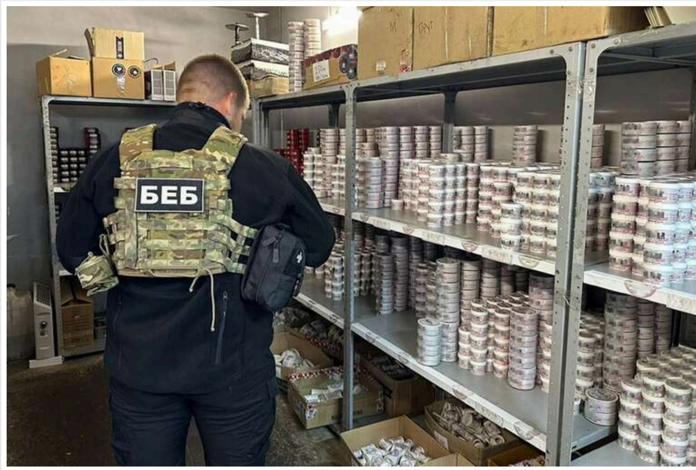
У фіналі конкурсу на голову БЕБ – 16 кандидатів: серед них фігуранти медійних розслідувань та експівробітники часів Януковича

Читати на руськом Read in English Додати як бажане джерело в Google