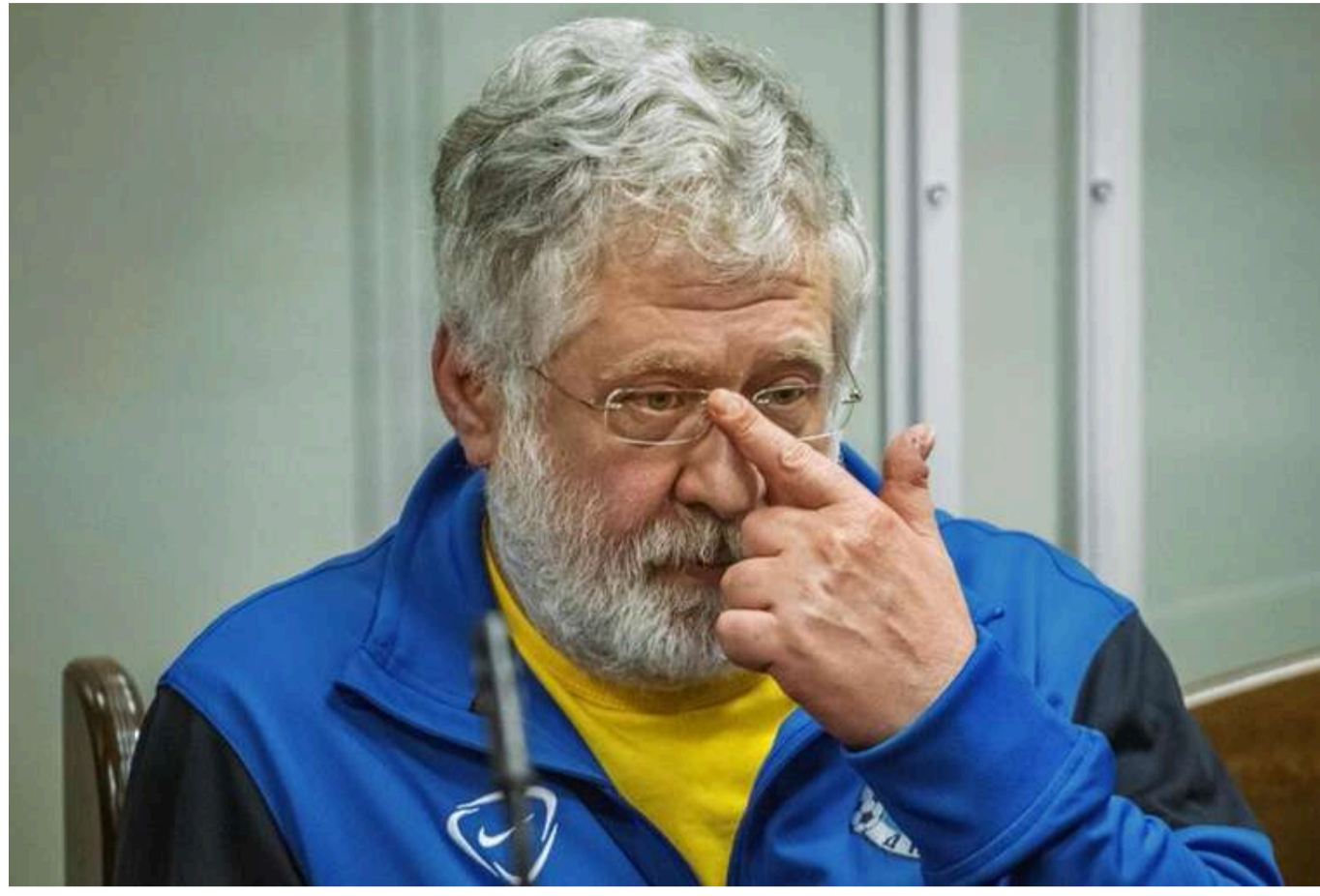
Коломойському продовжили тримання під вартою на 2 місяці у справі про замовне вбивство

Читати на русском Read in English Додати як бажане джерело в Google