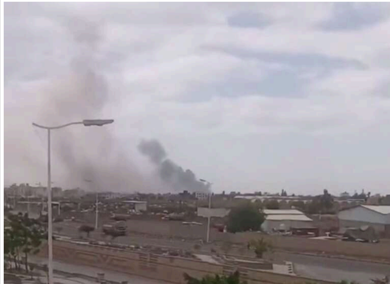
Ізраїль завдав ударів по аеропорту в Сані після атаки хуситів на Бен-Гуріон

Ізраїль завдає удар по аеропорту в Сані, столиці Ємену, після того як годину тому ізраїльська армія випустила заяву з попередженням про «термінову» евакуацію з аеропорту. Контроль над Сано утримують хусити.