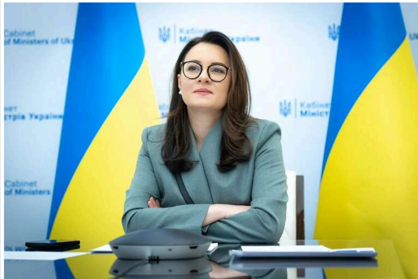
Свириденко: Україна не підписувала додаткових угод про надра зі США

Читати на руськом Read in English Додати як бажане джерело в Google