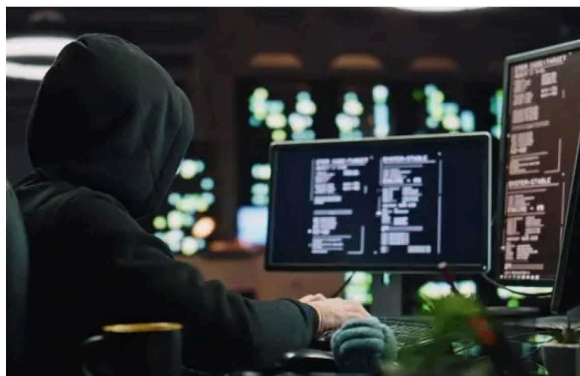
Кіберфахівці зафіксували розсилку шкідливих електронних листів

В Україні зафіксовано нову хвилю шахрайських електронних листів, які маскуються під повідомлення від імені НЕК "Укренерго". У них користувачам пропонують завантажити файли або перейти за посиланнями, що насправді містять шкідливе програмне забезпечення, здатне викрадати особисті дані.