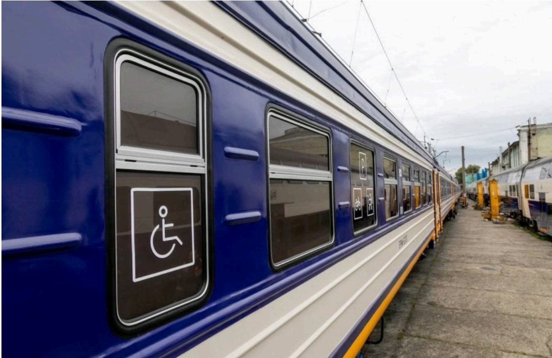
Рух поїздів у напрямку Київ–Фастів–Козятин тимчасово зміниться / Укрзалізниця

З 13 по 15 червня на ділянках Фастів–Козятин та Фастів–Миронівка зміниться рух приміських поїздів через термінові ремонтні роботи залізничної інфраструктури. Частину рейсів скасовано, натомість окремі напрямки будуть посилені та частково замінені автобусним сполученням.