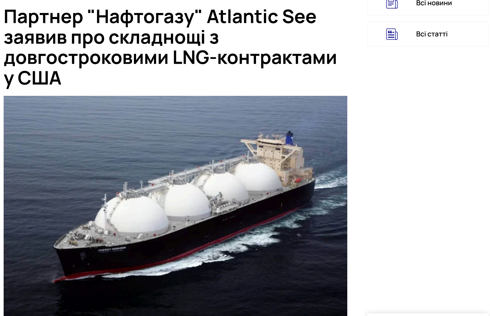
Партнер Нафтогазу попередив про зростання цін на 20-річні LNG-контракти

Грецька компанія Atlantic See LNG Trade, партнер Нафтогазу, заявила, що укласти довгострокові контракти на скрапленій природний газ зі США стає складніше. За словами її керівника Александроса Екзарху, американські постачальники менш охоче фіксують ціни на тривалий період через зміну ситуації на світовому ринку LNG.