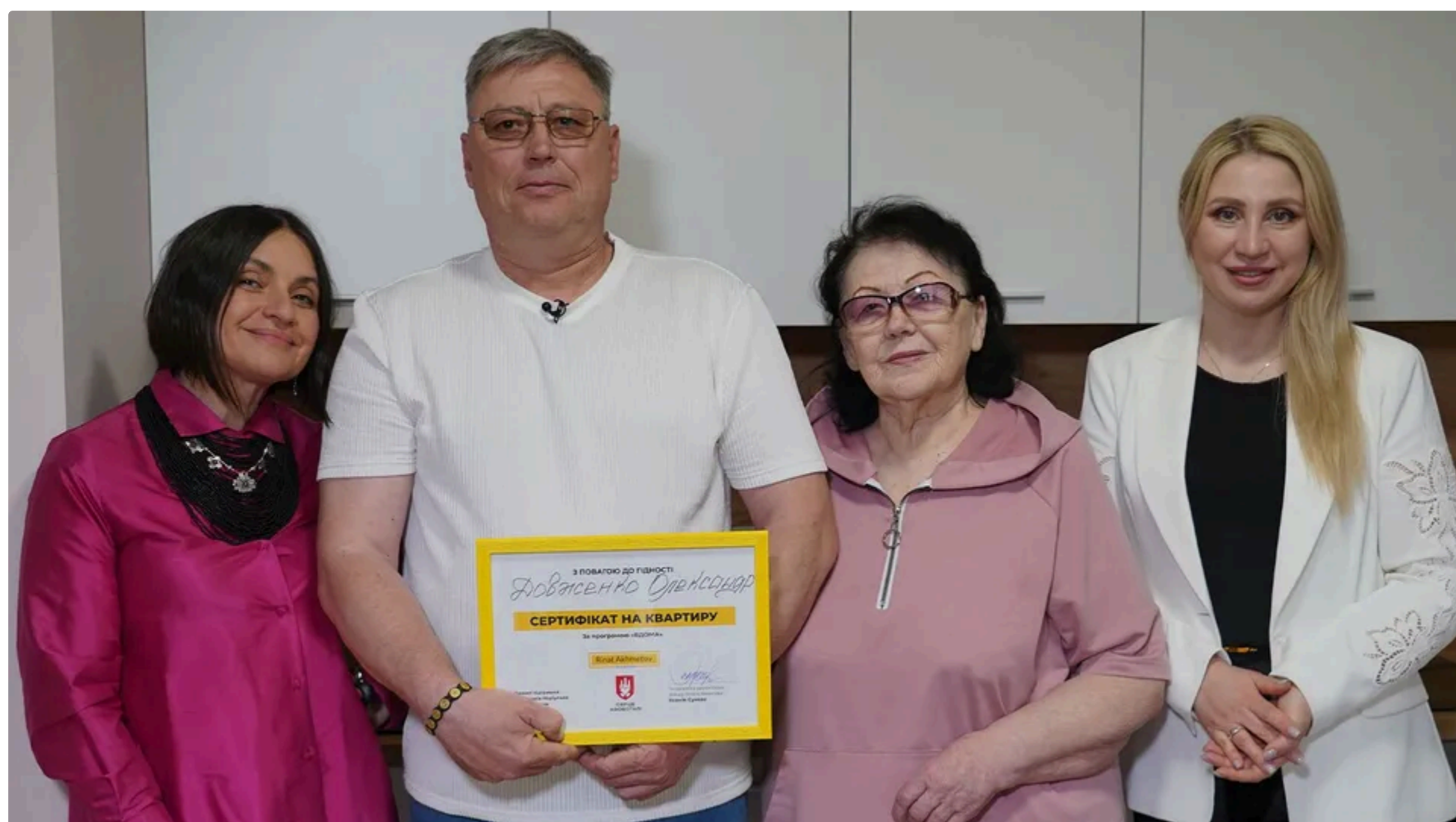
*"Серце Азовстали" забезпечило власним житлом військового, який захищав Маріуполь

11 червня, 14.54 🗨️ Этот материал также можно прочитать на русском