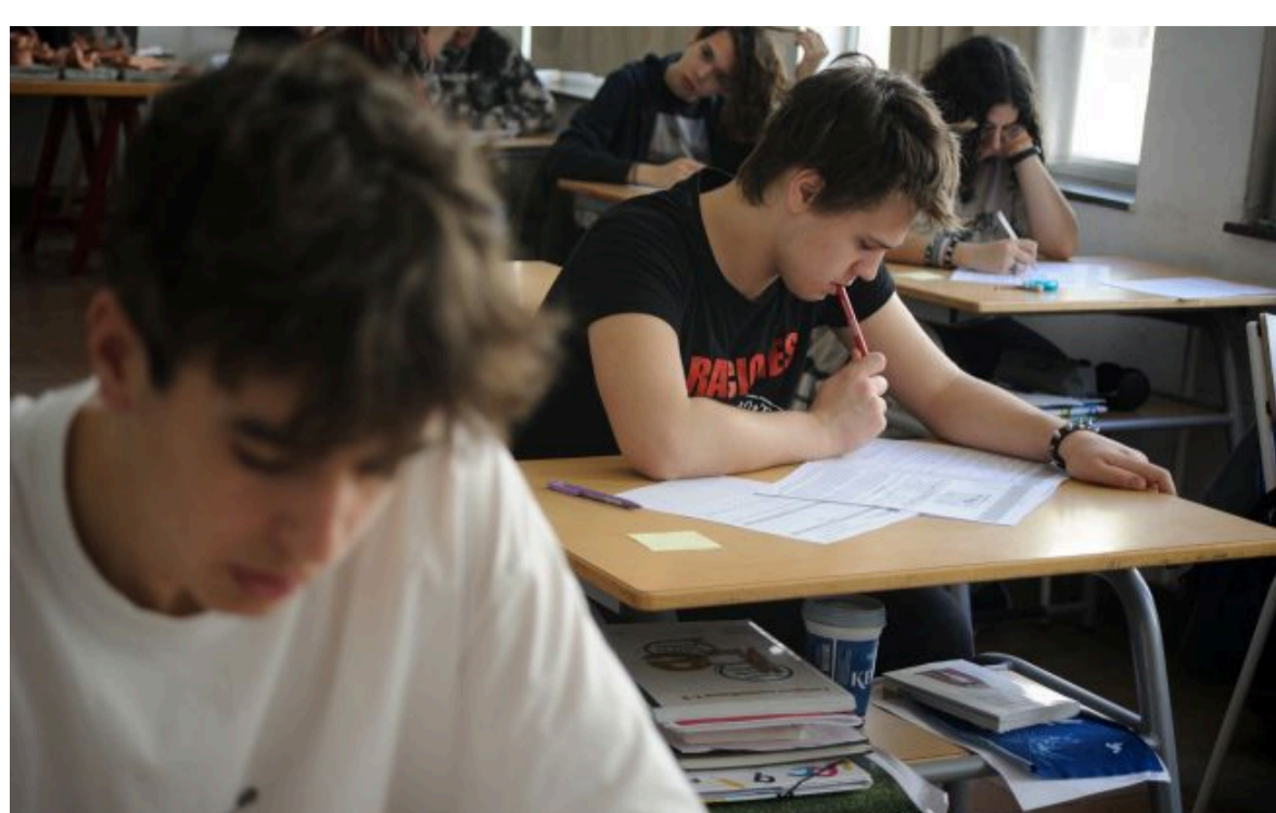
Фото: Вступна кампанія (Getty Images)

Не витрачай час на шум! Читай тільки суть з РБК-Україна у Google