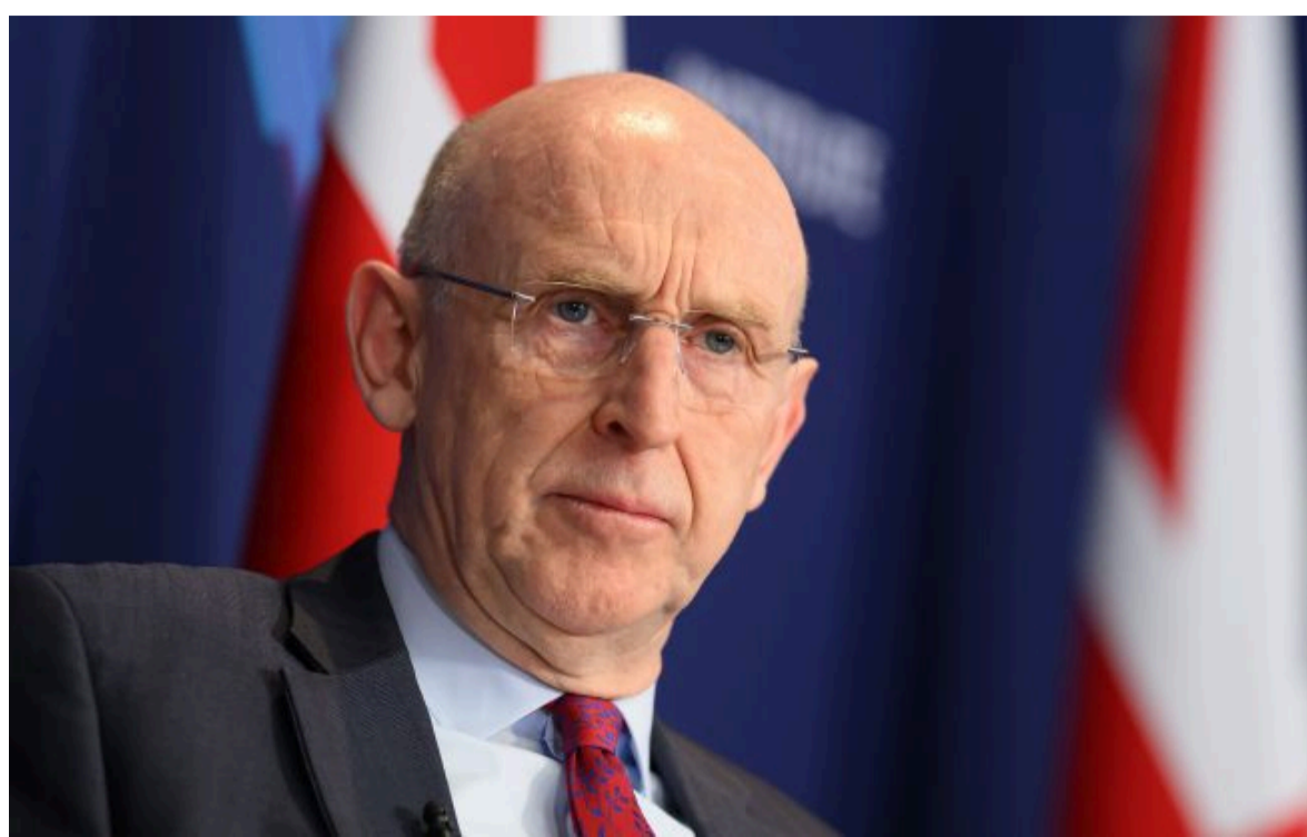
Фото: міністр оборони Британії Джон Гілі (Getty Images)