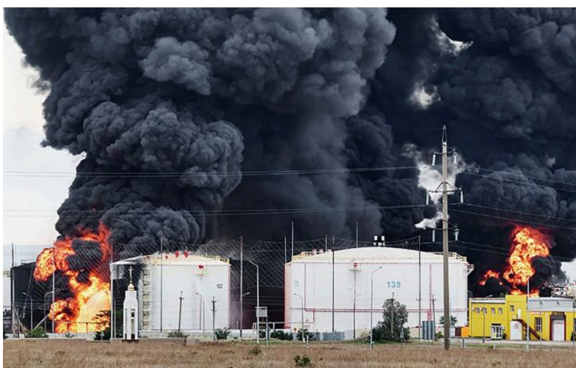
Далекобійні удари України знищують НПЗ та порти РФ