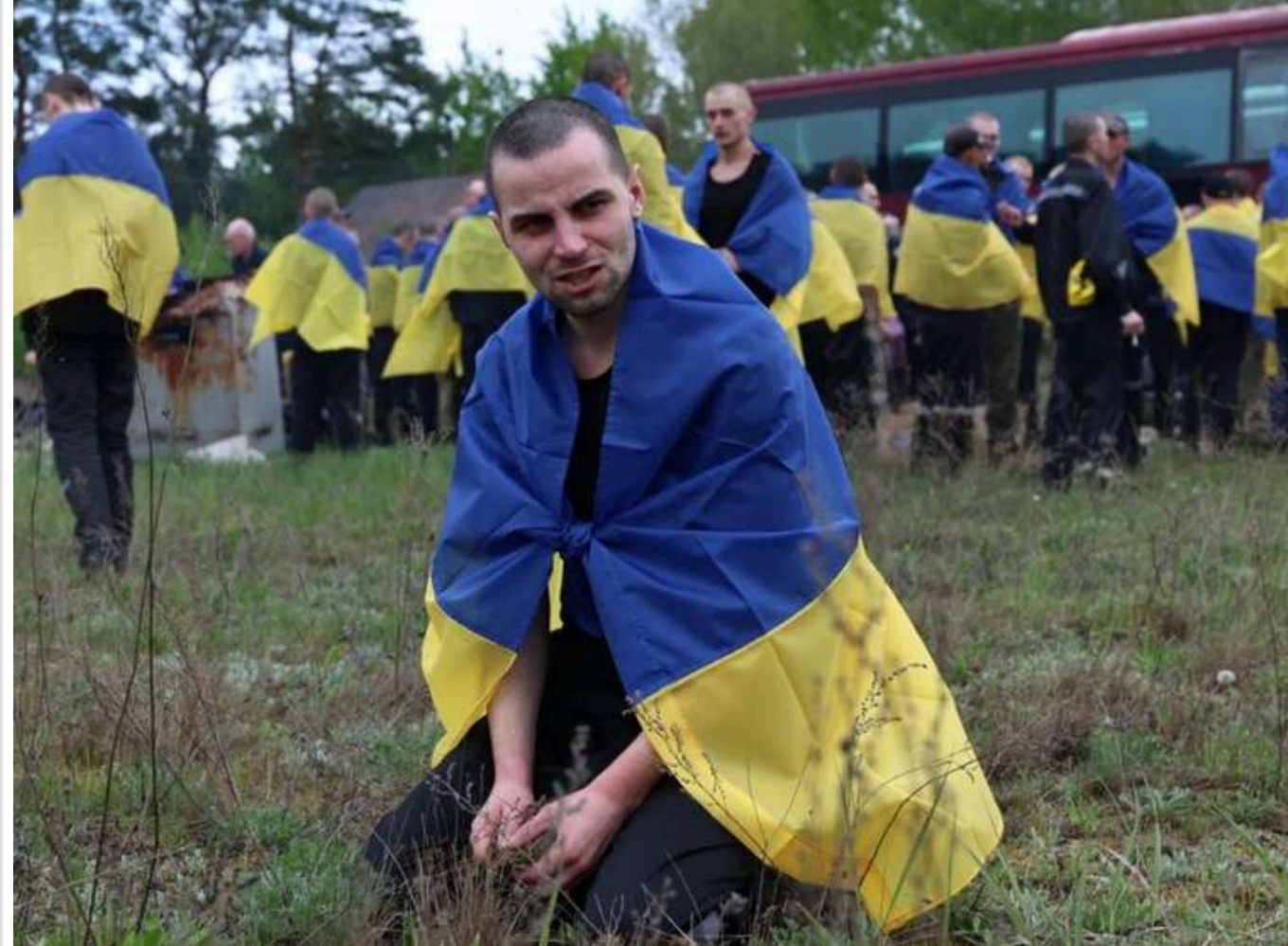
Відбувся 64-й обмін військовополоненими: Україна повернула з полону ще 205 захисників

Читати на руському Read in English Додати як обране джерело в Google