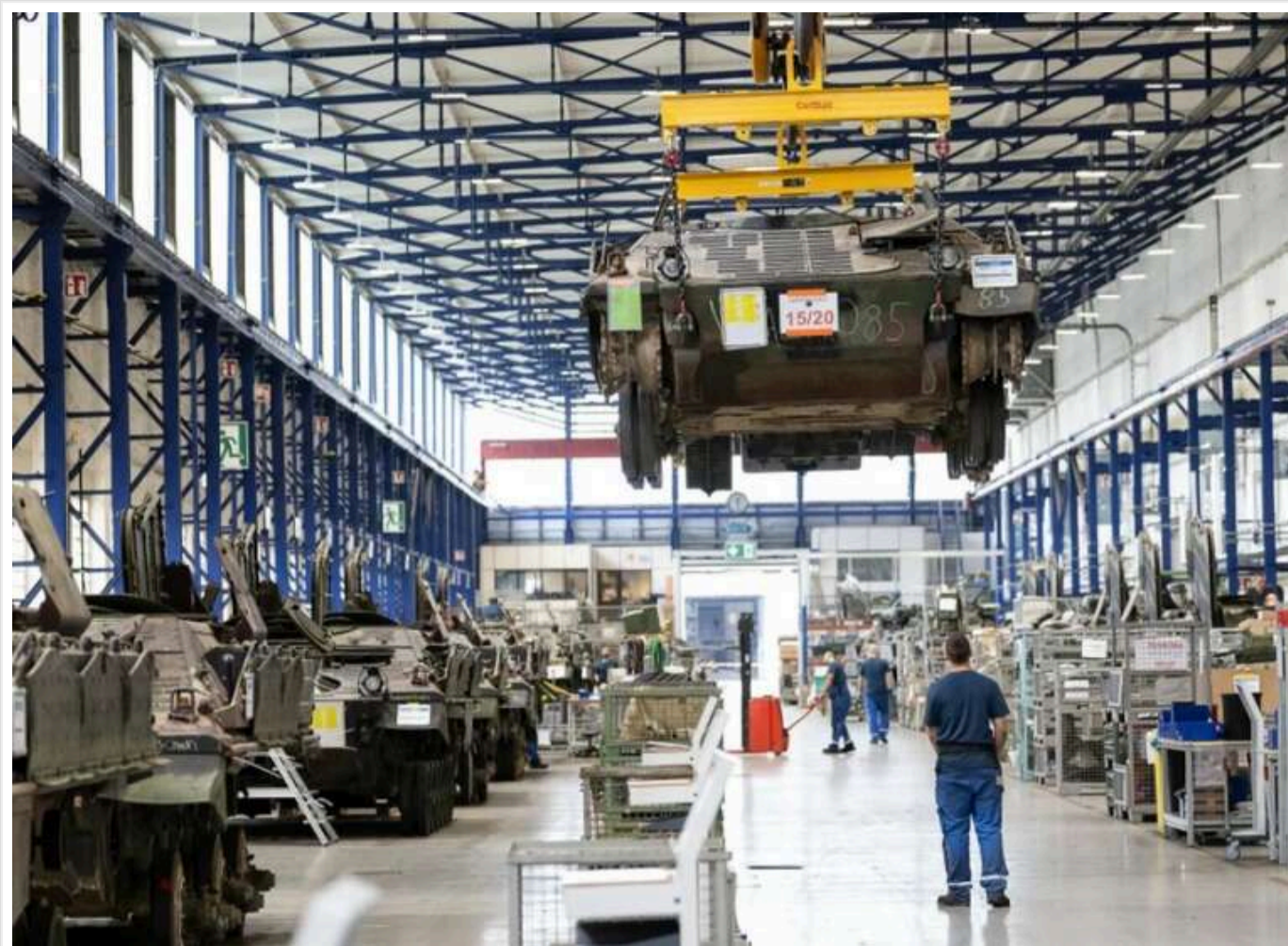
Україна готується зняти заборону на експорт зброї: є погодження від Зеленського - Forbes

Україна планує скасувати чинну заборону на експорт озброєння до інших країн. Як повідомляє Forbes із посиланням на джерела в уряді та оборонній сфері, політичне рішення щодо відкриття відповідного механізму вже узгоджено з Президентом Володимиром Зеленським.