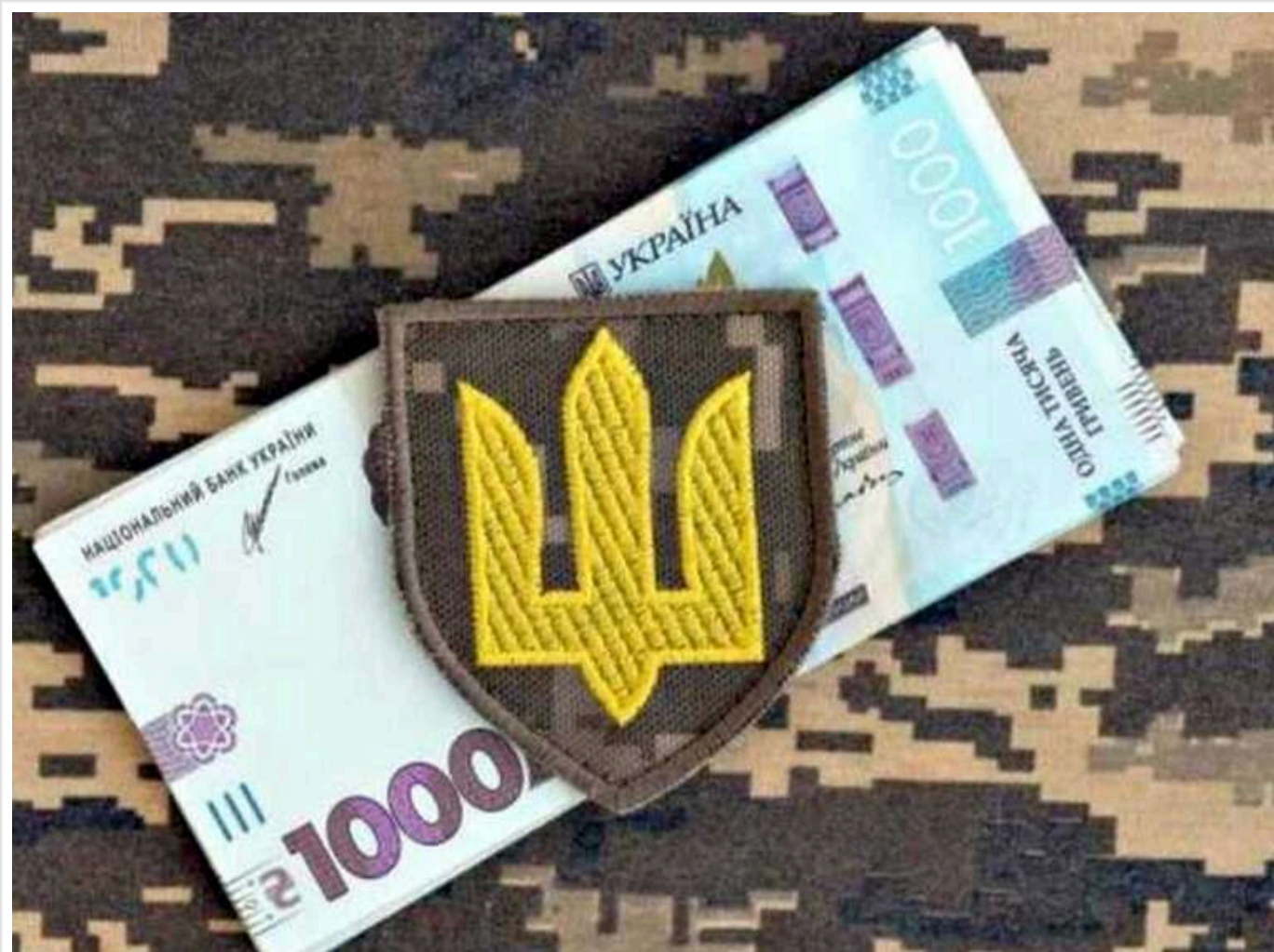
Гетманцев: військовий збір після війни не скасують, але знизять до 1,5%

Читати на руском Read in English Додати як бажане джерело в Google