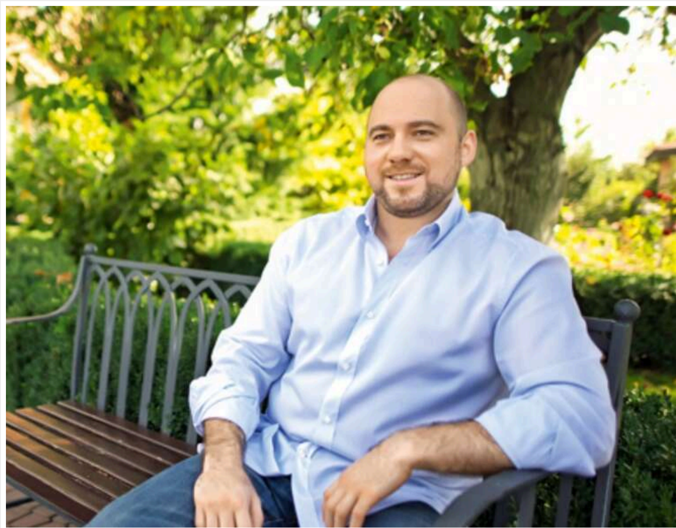
12 народних обранців задекларували резиденції площею понад 1000 "квадратів": лідер – Столар із будинком на 2000 м 2

Читати на російською Read in English Додати на обране меню в Google