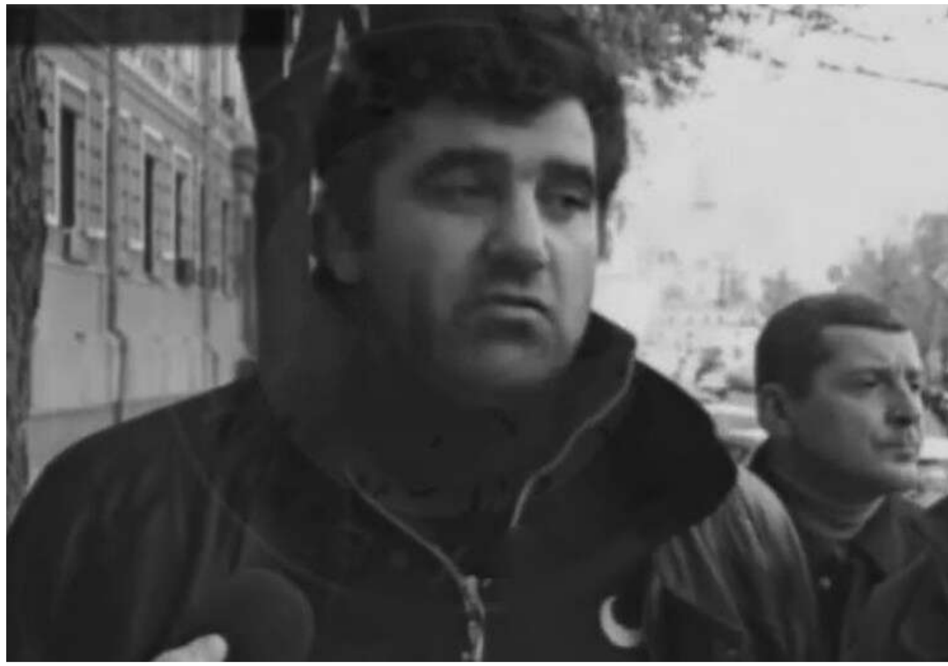
Помер "папа" київської мафії 90-х Віктор Авдишев, який з бандою тримав у страху Республіканський стадіон

У ніч проти 5 травня 2025 року помер Віктор Авдишев, колишній лідер легендарного київського бандурупування 90-х років.