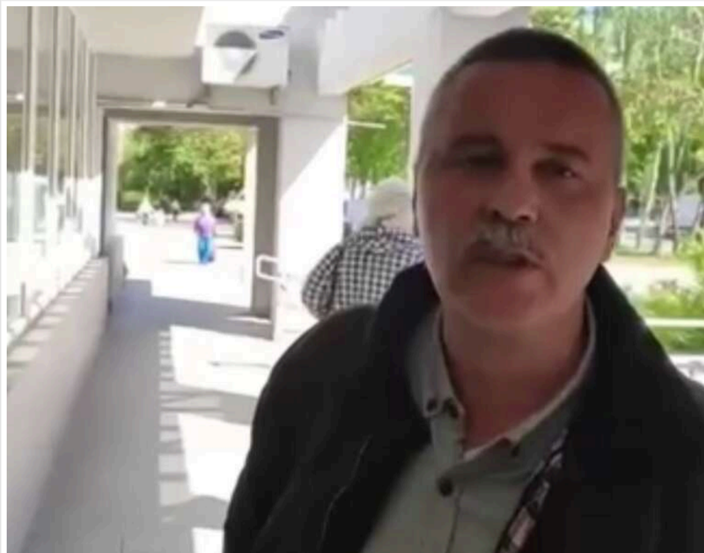
"Ти не солдат, ти боягуз смердючий": У Львові мешканці обматюкали військового за спробу скористатися правом позачергового обслуговування

У Львові стався інцидент за участі військового, який три роки провів на фронті, та місцевих мешканців, які обурилися тим, що чоловік звернувся за обслуговуванням поза чергою — попри те, що це передбачено законом.