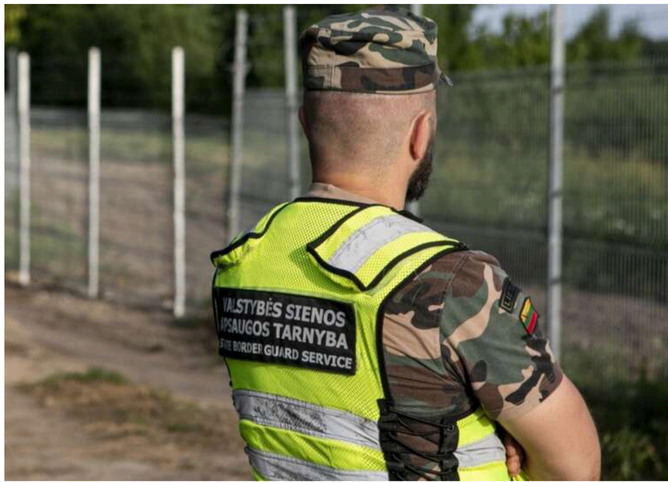
Литва планує збудувати масштабну лінію оборони на кордоні з Росією та Білоруссю

Литовська опозиційна партія пропонує створити оборонну лінію на кордоні з Росією та Білоруссю, щоб підвищити готовність країни до можливих загроз. Назва цієї лінії буде "Лінія оборони імені Вітаутаса Великого".