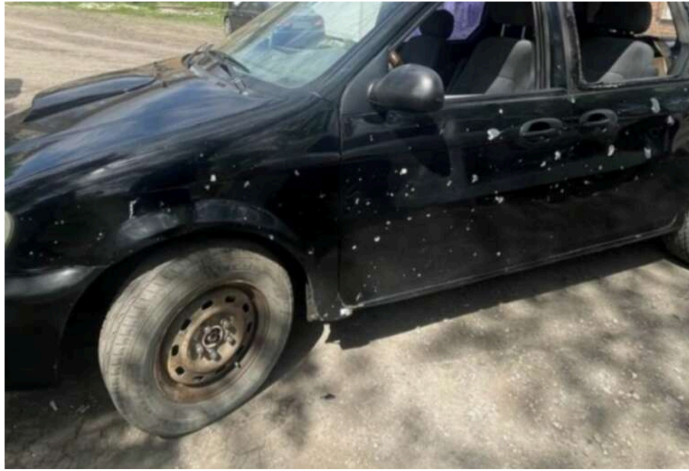
Кількість поранених унаслідок російських обстрілів у Донецькій області зростає до восьми

Читати на руськом Read in English Додати як бажане джерело в Google