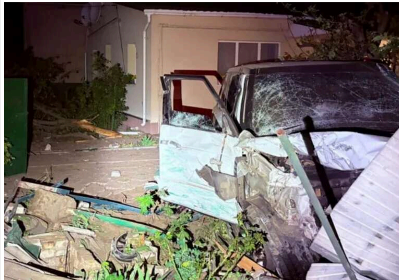
У Київській області нетвереза водійка позашляховика врізалася в паркан

У Фастівському районі Київської області нетвереза водійка автомобіля Land Rover на великій швидкості в'їхала в паркан. Внаслідок зіткнення один із каменів огорожі відлетів у будинок і потрапив жінці в голову.