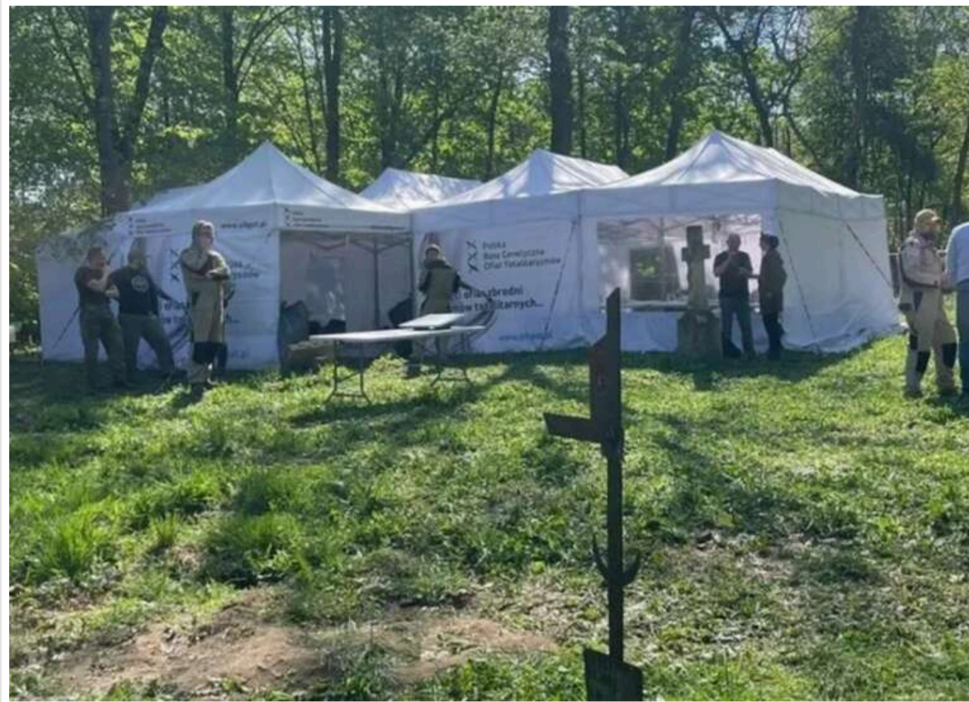
У Пужниках завершують ексгумацію жертв Волинської трагедії - знайдено останки понад 30 осіб

Читати на руськом Read in English Додати як бажане джерело в Google