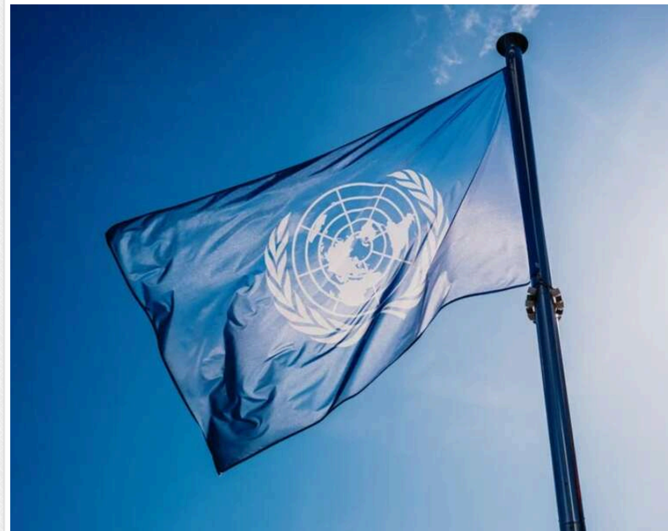
ООН закликала світ негайно вплинути на дії Ізраїлю в Газі

Понад два місяці ізраїльська влада повністю блокує постачання гуманітарної допомоги до Сектора Гази, включно з продуктами, ліками та водою. Через це закрилися пекарні, громадські кухні, склади спорожніли, а тисячі дітей залишаються без їжі.