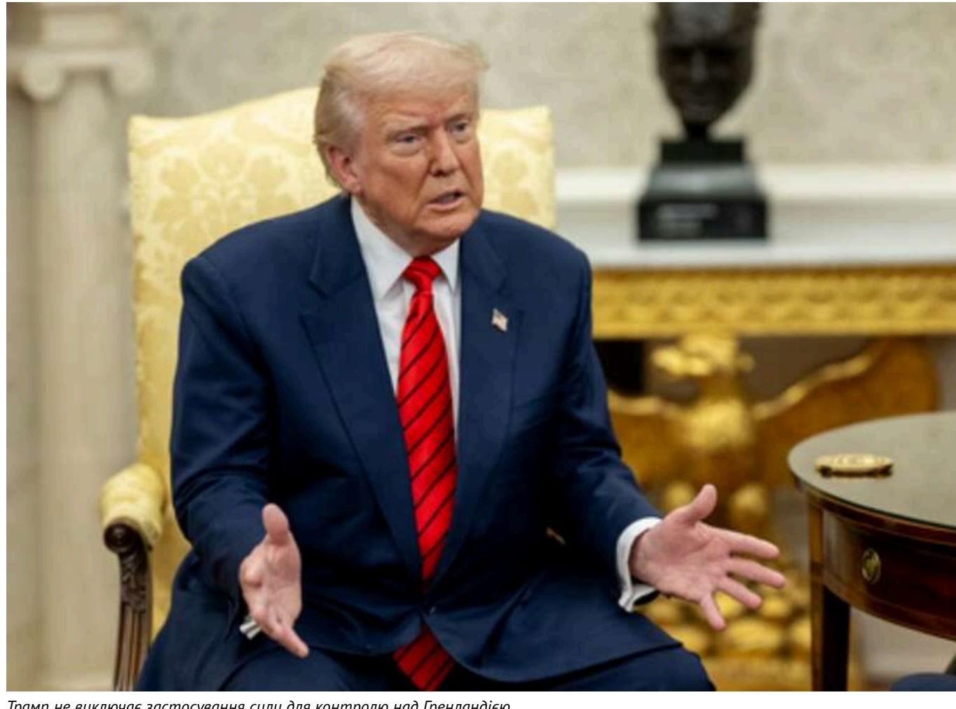
Трампа не виключає застосування сили для контролю над Гренландією

Президент Сполучених Штатів Дональд Трамп не виключив можливість застосування військової сили для встановлення контролю над Гренландією.