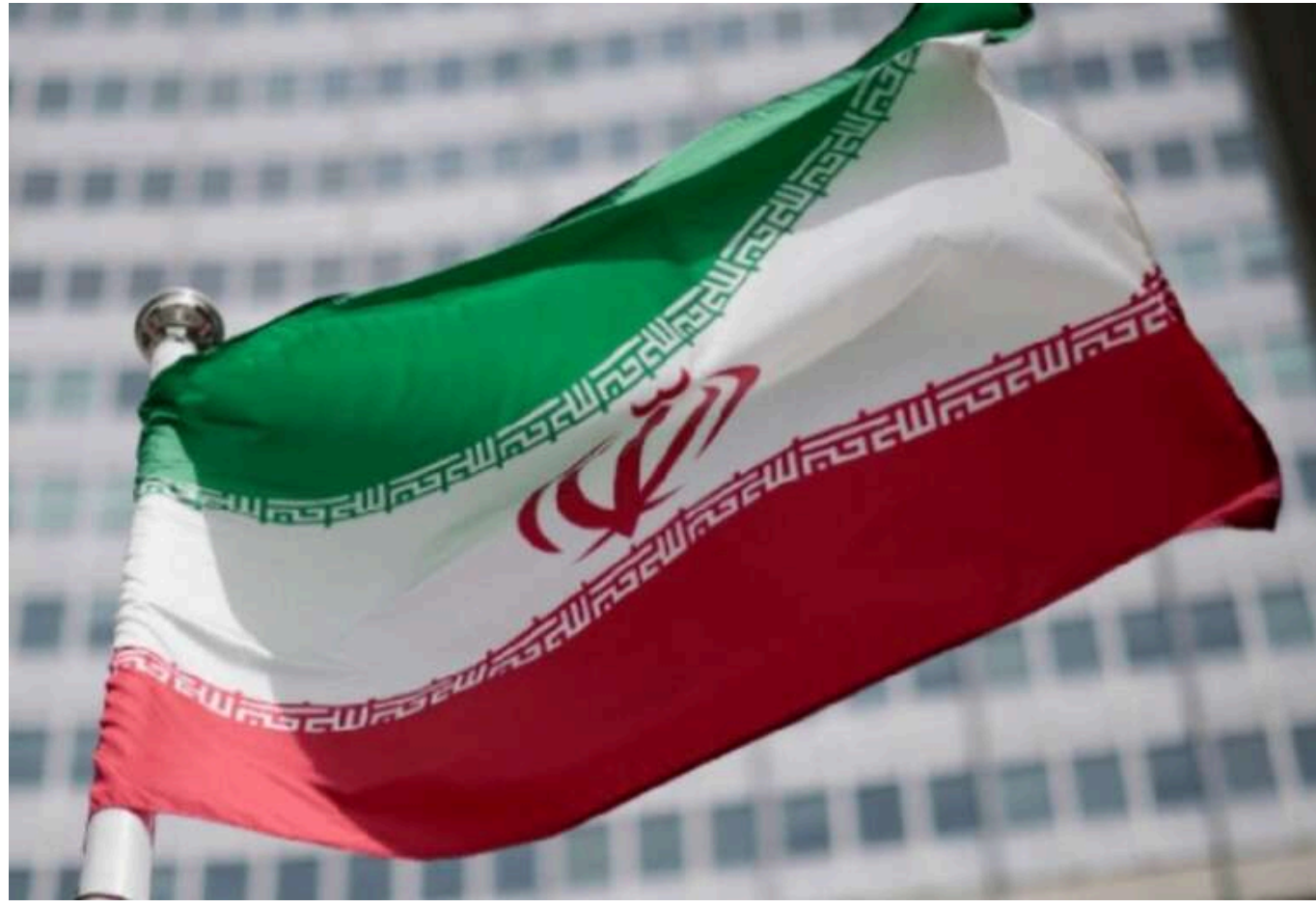
Іран пообіцяв завдати ударів по базах США та Ізраїлю, якщо буде відповідь на атаку аеропорту в Тель-Авіві

У понеділок, 5 травня, міністр оборони Ірану Азіз Насірзаде заявив, що Тегеран завдасть удару, якщо США або Ізраїль вирішать відповісти на удар хуситів по аеропорту в Тель-Авіві.