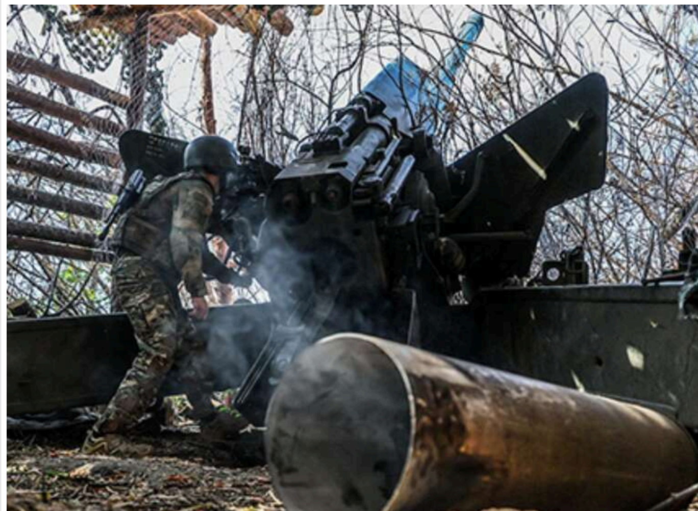
Лиманський напрямок вийшов на друге місце за кількістю бойових зіткнень, - військовий

Читати на руськом Read in English Додати як бажане джерело в Google