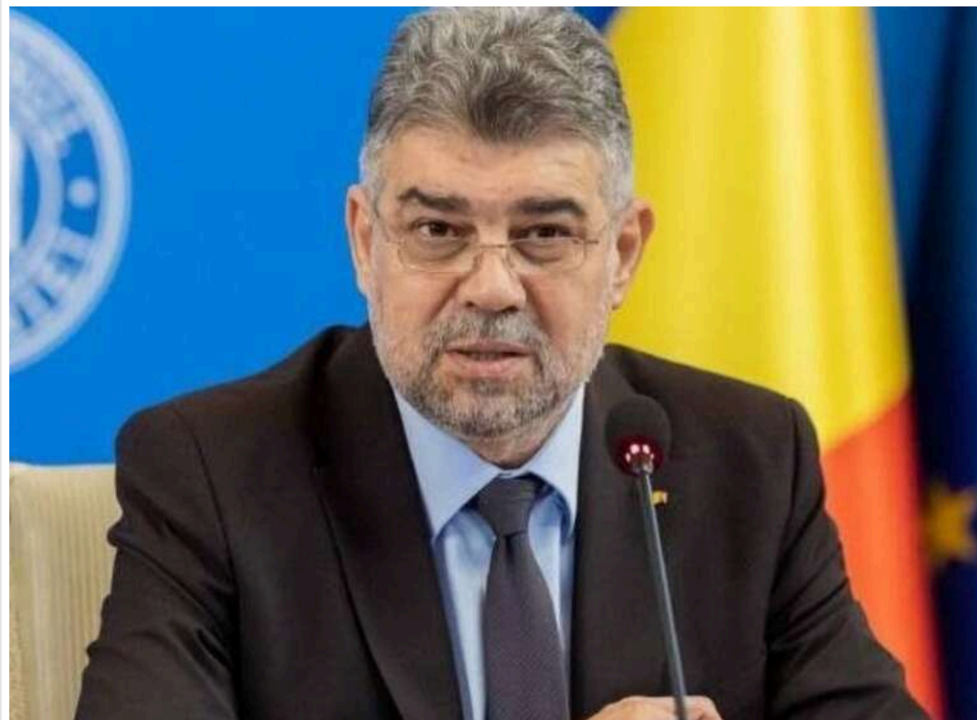
Прем'єр Румунії Чолаку може подати у відставку після провалу на виборах

Марчел Чолаку розглядає можливість піти у відставку з посади прем'єр-міністра після невдалого результату кандидата від коаліції на президентських виборах.